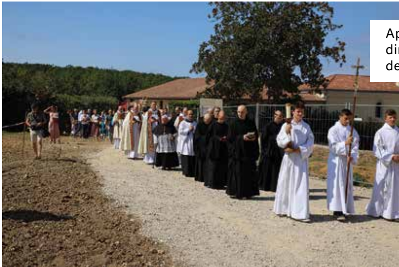
Après la messe pontificale, direction le chantier, au chant des litanies de la Sainte Vierge.