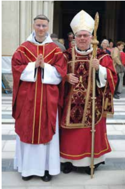
À la fin de la messe