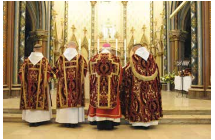
Prières au bas de l'autel au début de la messe Au trône, derrière l'autel