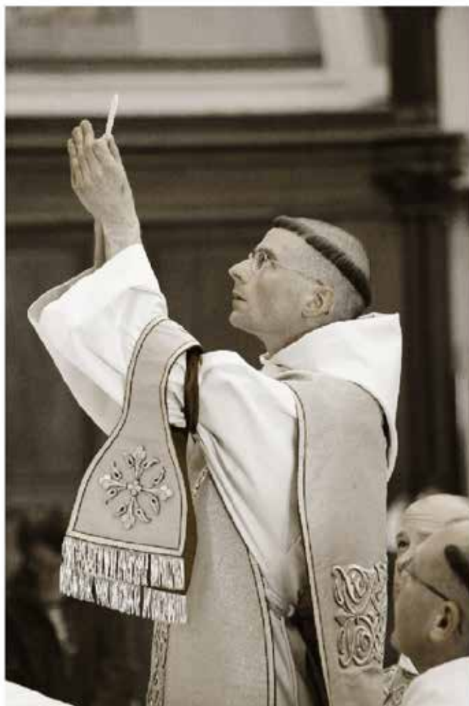
Première messe du nouveau prêtre