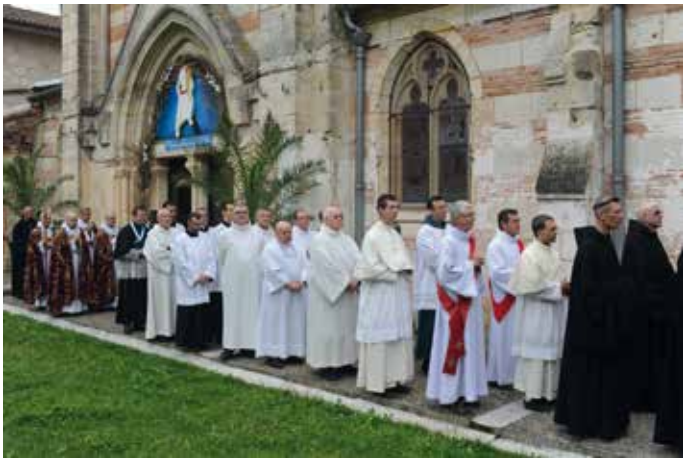
Le clergé avant l'entrée dans la basilique