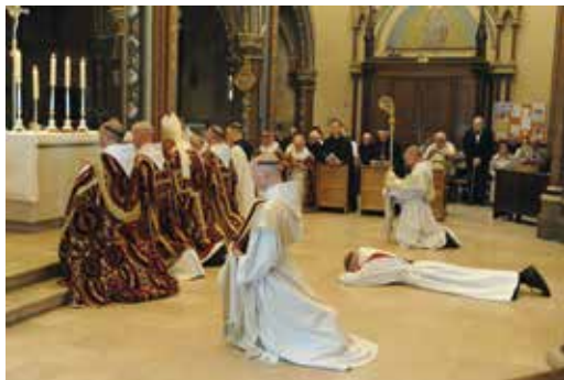
Les litanies des saints – prostration du futur prêtre