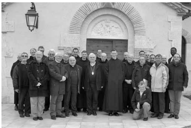
Notre évêque, son conseil presbytéral et une partie de la communauté

2 février : pour la clôture de l'année de la vie consacrée, nous recevons notre évêque et son conseil presbytéral.